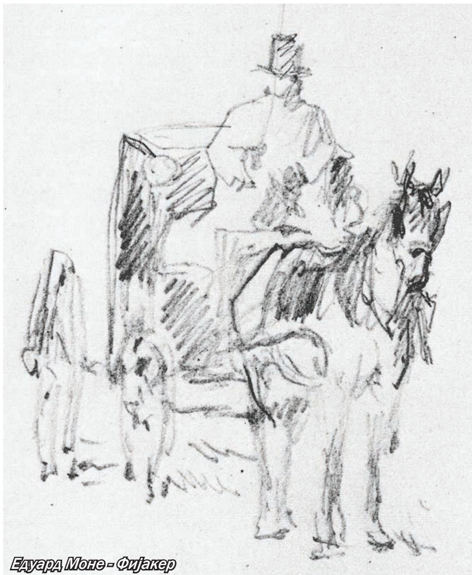
Едуард Моне - Фијакер