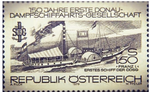
Први пароброд на Дунаву - Франц Први